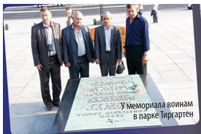
У мемориала воинам в парке Тиргартен