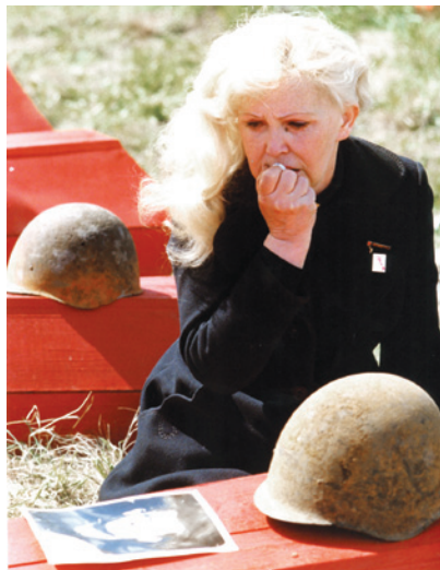
Скорбь.