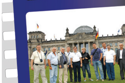
Делегация МРСК Северо-Запада у здания Рейхстага