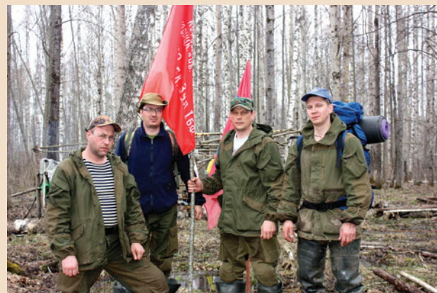
Первая экспедиция отряда «Шкраб»

Члены поисковых отрядов собирают людей, молодежь вокруг действительно