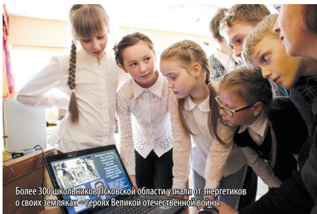
Более 300 школьников Псковской области узнали от энергетиков о своих земляках - героях Великой отечественной войны

В архивах филиала «Псковэнерго» и пожарных частей МЧС Псковской области сохранились сведения о сотружниках, которые прошли войну и вернулись на родную землю восстанавливать мирную жизнь. Региональные энергетики и пожарные не первый год проводят в школах области совместную акцию по пожарной и электробезопасности. Их новая совместная работа - просветительская акция для областных школьников о героях псковской земли.