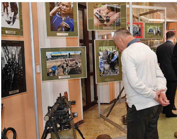
Фотовыставка «Долина нашей памяти»

С 15 апреля фотовыставка «Долина» нашей памяти», организованная сотрудниками «Новгородэнерго», две недели экспонировалась в Москве в центральном офисе ОАО «Россети».