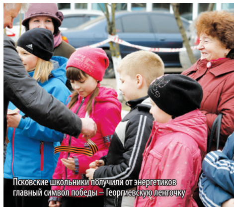
Псковские школьники получили от энергетиков главный символ победы - Георгиевскую ленточку